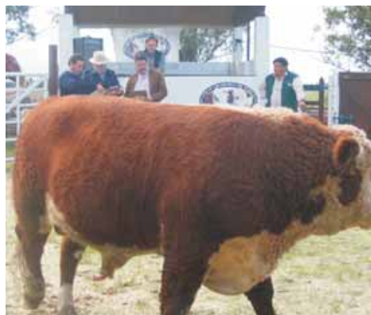
El jurado evaluando un toro al cierre de la Prueba 31.